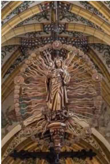
Zogen. Meester van Elsloo. Marianum . - Sint-Lambertuskerk in Neeroeteren.