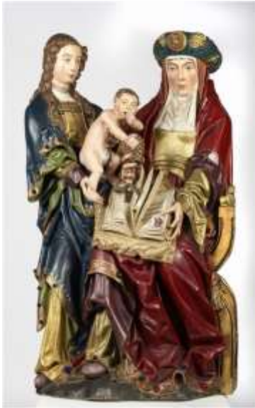
Zogen. Meester van Elsloo. Sint-Anna-te-Drieën . - Sint-Catharinakerk in Maaseik.