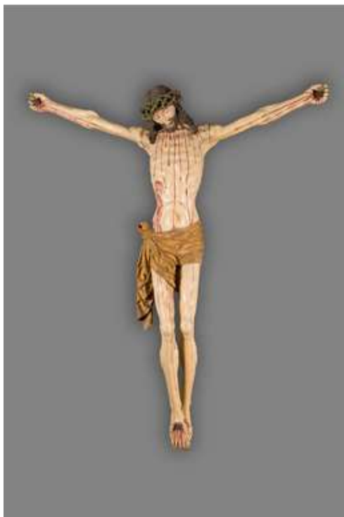
Zogen. Meester van Elsloo. Gekruisigde Christus . - Sint-Harlandis en Sint-Relindiskerk in Ellikom.