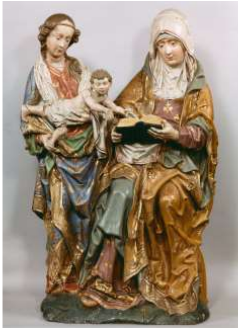
Zogen. Meester van Elsloo. Sint-Anna-te-Drieën . - Parochie Sint-Augustinus in Elsloo.