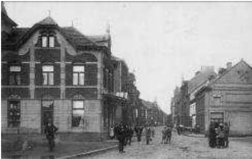
Passencontrole aan de Bospoort te Maaseik