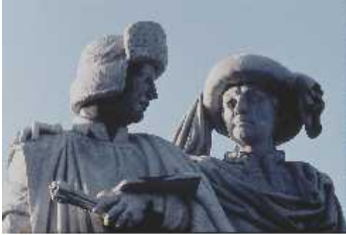
150 jaar standbeeld

Aangesloten bij de Federatie van Geschied- en Oudheidkundige Kringen van Limburg