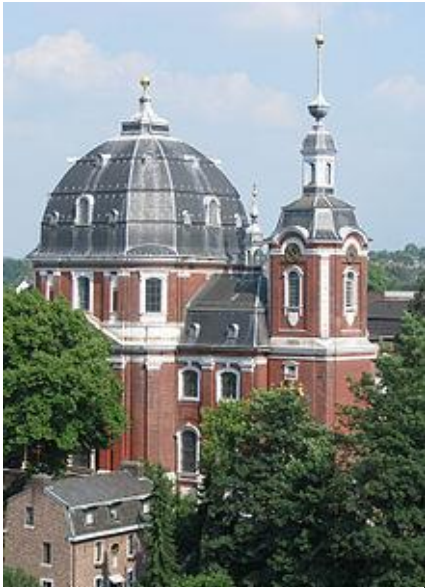
St. Jan de Doperkerk Burtscheid